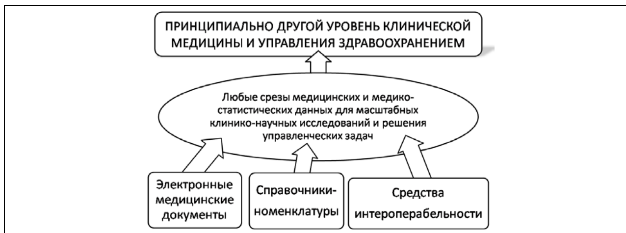
Рис. 2. Инновационность современного этапа информатизации здравоохранения

Без информатизации здравоохранения не было бы ни современных систем функциональной, лучевой, клинической лабораторной диагностики, ни систем интенсивной терапии. На современном этапе, решая задачи разработки ИЭМК, справочников и другие, мы закладываем «фундамент» под принципиально другой уровень клинической медицины и управления отраслью. При наличии общероссийских структурированных электронных медицинских документов, справочников-номенклатур, средств взаимодействия МИС мы получим то самое единое информационное пространство, в рамках которого можно осуществлять самые разные инновационные клиничко-научные исследования (рис. 2). Без фундамента, как известно, здания не построишь.